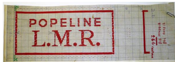
Mise en carte MRc1533 réalisée chez Derville et Delvoye, à Comines-France, en 1958.