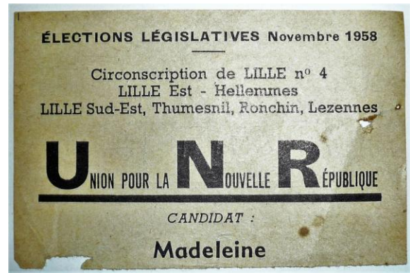
L'envers du décor de la pièce MRC1534 : un bulletin électoral de l'U.N.R. pour les élections législatives de 1958 à Lille.

Au-delà du fait que le réemploi d'un papier préfigure une politique de lutte contre le gaspillage et pour le respect de l'environnement, le document est riche d'enseignements.