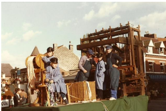
Char des rubaniers cominois devant leur métier à barre, au cortège de la Fête des Louches de 1981 (MRc1729).

Parmi les grandes festivités folkloriques du Nord de la France, la Fête des Louches jouit d'une belle renommée depuis déjà plus d'un siècle. Créée en 1884 par les résidents du quartier du Château, elle n'en