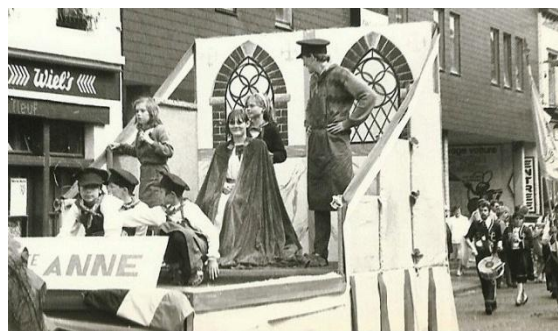
Le char de sainte Anne au cortège des Marmousets en 1984.

A Comines, le lundi et le mardi suivant la fête de la sainte, fixée au 26 juillet par décret papal (sous Urbain VI, en 1286), sont déclarés fériés. Une effigie d'Anne trône d'ailleurs fièrement au sein de la chapelle du château de Comines.