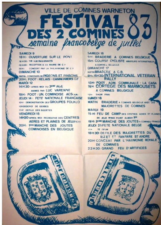
Première affiche de la « Fête des Marmousets », incluse au sein du « Festival des Deux Comines », en 1983 (MRc1726).

C'est ainsi que les drapiers se transformèrent, pour une bonne partie d'entre eux, en rubaniers, les autres s'étant exilés en Angleterre ou reconvertis dans d'autres formes d'économie. Ils « troquèrent » alors sainte Anne pour sainte Catherine d'Alexandrie, tout en n'oubliant pas qu'à l'origine, leurs aïeux réalisaient du drap. Ils continuèrent donc d'honorer leur ancienne patronne à la fin du mois de juillet, autour de la « ducasse Sainte-Anne ».