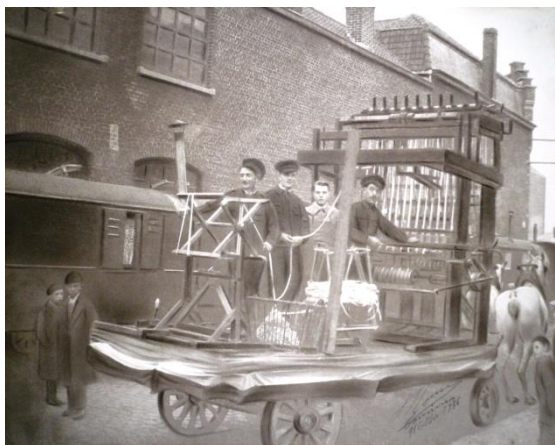
Le char des rubaniers à la Fête des Louches 1936 (MRc116).

Mais la Fête des Louches est aussi le lieu de célébration du patrimoine rubanier de Comines. Ainsi, si les légendes tournant autour de la louche les éclipsent quelque peu, les « bleus vintes » sont bien là, que ce soit à travers le cortège des Allumoirs rappelant celui des « épeuleurs » (ou enfants chargés de réaliser les canettes de fil) et de leur fête, ou encore via les deux figures gigantesques principales de Comines-France : le couple de rubaniers Grande Gueuloute et P'tite Chorchire, par ailleurs fraudeur des deux côtés de la Lys !