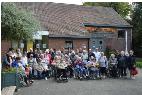
Le 19 septembre, les membres de l'ASBL « Rayon de soleil » ont émaillé La Rubanerie d'une visite transgénérationnelle.

Si le moment est d'ores et déjà aux premiers bilans, force est de reconnaître que, du côté de nos rubans, il est largement positif. Non seulement la fréquentation de notre institution a été émaillée par de très bons chiffres, mais nos activités tant à l'intérieur qu'hors de nos murs, ont connu un grand succès.