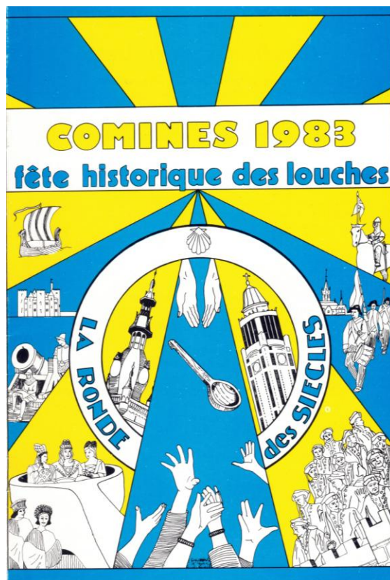
Programme 1983 de la fête des Louches (MRc2720).