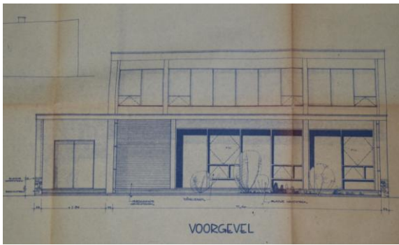
Plan de la façade de la chapelle des Cinq-Chemins par l'architecte Christian Vastesaeger (1959).

Ces six exemples témoignent bien qu'en plus d'être une « terre à briques », Comines-Warneton a su aussi user d'autres matériaux issus de la révolution industrielle tels le béton, le métal et le verre.