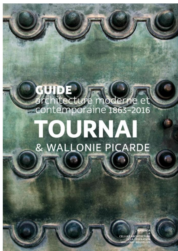
La couverture du guide d'architecture.