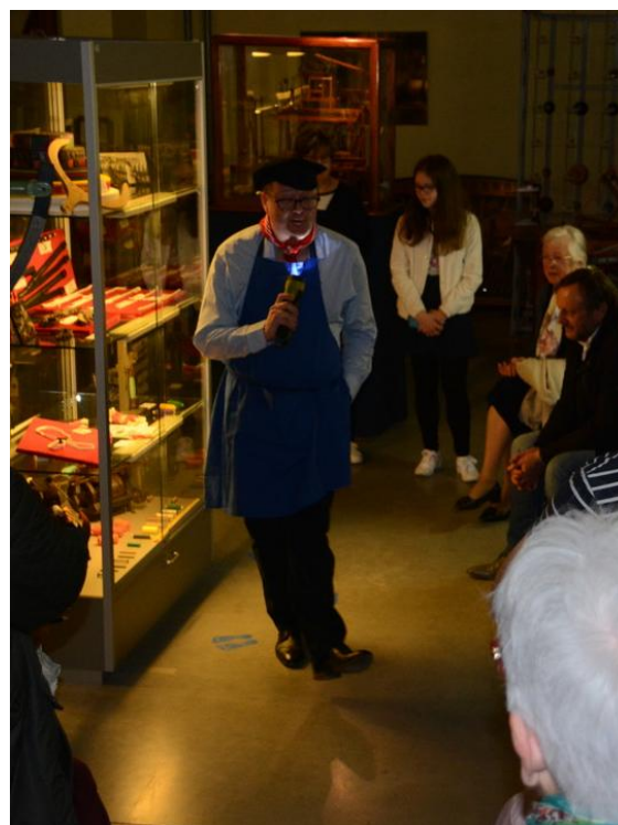
Un marmouset vantant les mérites de la rubanerie cominoise accompagné d'une brochette de stars ? A découvrir...

Cette opération sera notamment émaillée par une visite guidée spéciale (et gratuite) autour des tombes remarquables des industriels cominois, les 15 et 16 septembre. Rendez-vous à 14 heures 30 à la Maison du Patrimoine (inscriptions au 00 33 320 14 21 51 ; programme complet : http://www.ville-comines.fr/img/files/PDF_DIVERS/bd-plaquette-jep2018.pdf ).