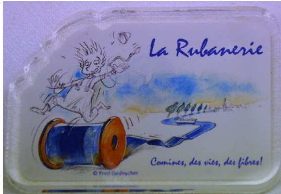
Le magnet « La Rubanerie » vous aimantera pour 2,50 €.

Mais qui dit idées à noter dit aussi stylo de qualité (et en plus, ça rime). Ici aussi, notre petit rubanier est à votre service et vous rendra la tâche plus légère : à 2 € la pointe bic, c'est quasi donné ! D'autant plus qu'avec sa malice, notre marmouset vous aidera à dérouler bien des rubans de mots sensibles sur le papier !