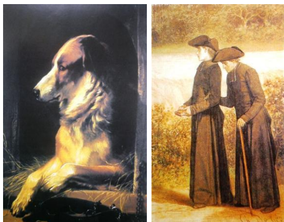
« Chien » (1858) par Eugène Verboecheven et « regrets » (s.d.) par Charles Degroux (Coll. Ville de Comines-Warneton).

de Degroux témoigne de la lutte de ces « Misérables » qui n'ont bien souvent de recours que dans l'alcool, la foi et les arts divinatoires ! A côté d'eux, un écrivain a cristallisé une vision romantique de Comines, notamment autour de son patrimoine médiéval : Pierre Paul Denys. Son « Meurtre au château de Comines », prélude à la traditionnelle « Fête des Louches », campe un Moyen-âge servant de référence absolue à la fierté de la toute jeune Belgique, même s'il cherche davantage à cultiver un sentiment nationaliste flamand. En ce sens, son œuvre traduit un mélange des styles de Victor Hugo et d'Henri Conscience.