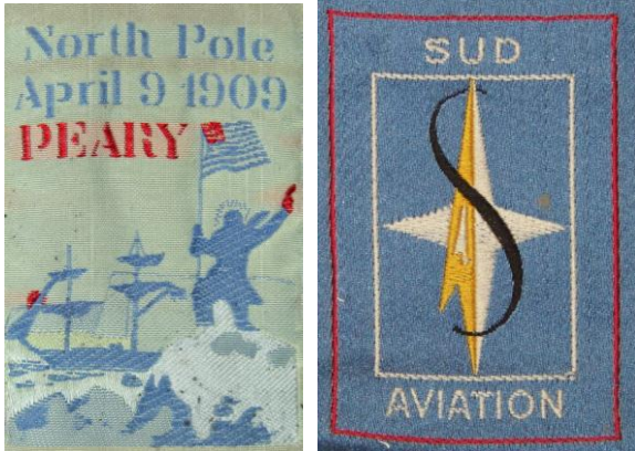
Commémoration de l'expédition au Pôle Nord (MRc481) et logo de la société « Sud Aviation » (MRc 496).

En cours d'inventorisation, la collection de rubans du Musée dévoile petit à petit ses trésors. Commémorations de découvertes (l'expédition Peary au Pôle Nord, en 1909), d'actions insolites (une partie de tennis sur les ailes d'un avion biplan en 1925), émanation des idées nouvelles autour d'une esthétique en phase avec l'histoire, évolution des logos d'entreprises confirmées (« Sud Aviation », une des sociétés à la base du géant « E.A.D.S. », anciennement « Airbus industries »), création d'images et mise en forme de groupes aujourd'hui mondialement célèbres (« Stocks Américains de Bruay-en-Artois », aujourd'hui devenu « Leroy-Merlin »)... ces bouts de tissus se sont, au fil des décennies, chargés d'histoire(s), de légendes, de mémoires humaines et industrielles.