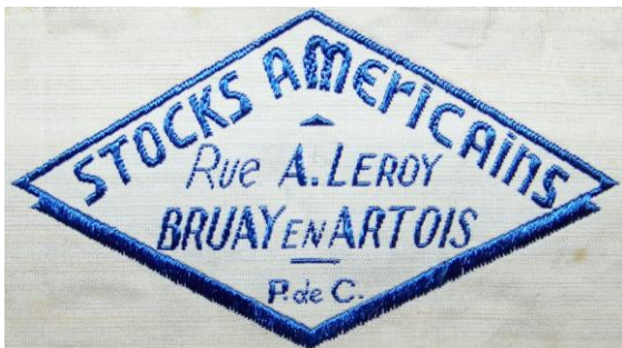
Les débuts du futur groupe « Leroy-Merlin » (MRc542).

En cours d'inventorisation, la collection de rubans du Musée dévoile petit à petit ses trésors. Commémorations de découvertes (l'expédition Peary au Pôle Nord, en 1909), d'actions insolites (une partie de tennis sur les ailes d'un avion biplan en 1925), émanation des idées nouvelles autour d'une esthétique en phase avec l'histoire, évolution des logos d'entreprises confirmées (« Sud Aviation », une des sociétés à la base du géant « E.A.D.S. », anciennement « Airbus industries »), création d'images et mise en forme de groupes aujourd'hui mondialement célèbres (« Stocks Américains de Bruay-en-Artois », aujourd'hui devenu « Leroy-Merlin »)... ces bouts de tissus se sont, au fil des décennies, chargés d'histoire(s), de légendes, de mémoires humaines et industrielles.