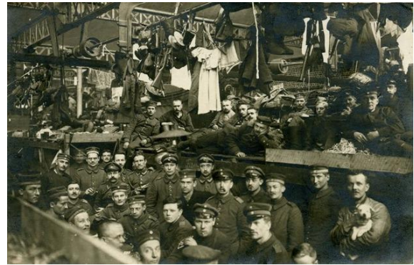
Quand les usines textiles cominoises étaient réquisitionnées pour la troupe allemande (06-03-1916 -)...