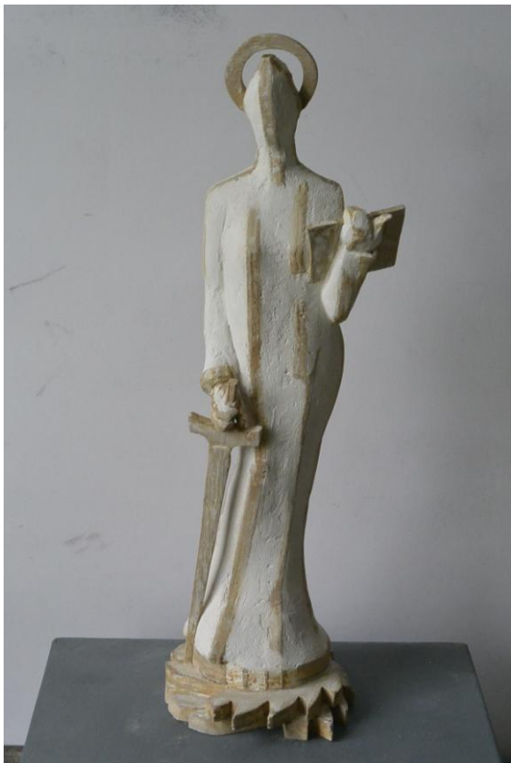
Sainte Catherine (2015) vue par John Bulteel (© J. Bulteel).

Car qui sait encore que la Fête des Marmousets, appelée avant 1983 « Festival des deux Comines », trouve ses origines à la fin du Moyen Âge, au moment où nos tisserands rendaient hommage à leur patronne : sainte Anne, la mère de la Vierge ?