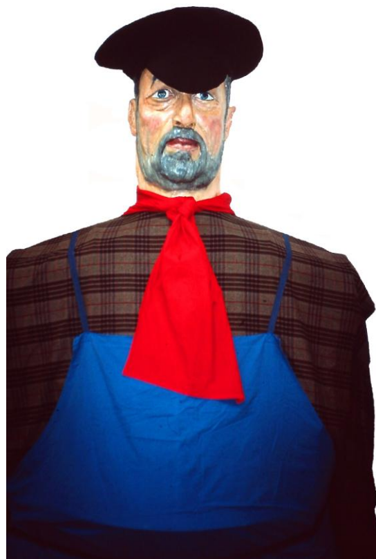
Simon le rubanier, géant créé pour la fête des Marmousets et baptisé devant le Musée de la Rubanerie le 7 mai 2009.

Les figures gigantesques liées à la mémoire textile cominoise seront aussi de la partie, d'Aristide le Meilleur à Grande Gueloute, en passant par Simon le Rubanier ou encore Luc le Marmouset, parce que ce folklore, s'il a été « revitalisé » il y a quelques décennies, n'en plonge pas moins ses racines bien plus loin.