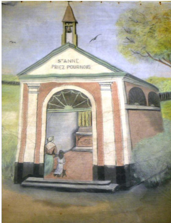
« Les fêtes de sainte Anne 1687 à Comines » (détail), une toile peinte par Henri Coulie (Collection SHCWR).

cimetières de la Grande Guerre, de la reconstruction de Comines ou encore des mutations urbaines de Houthem et de la séparation de Ploegsteert et de Warneton.